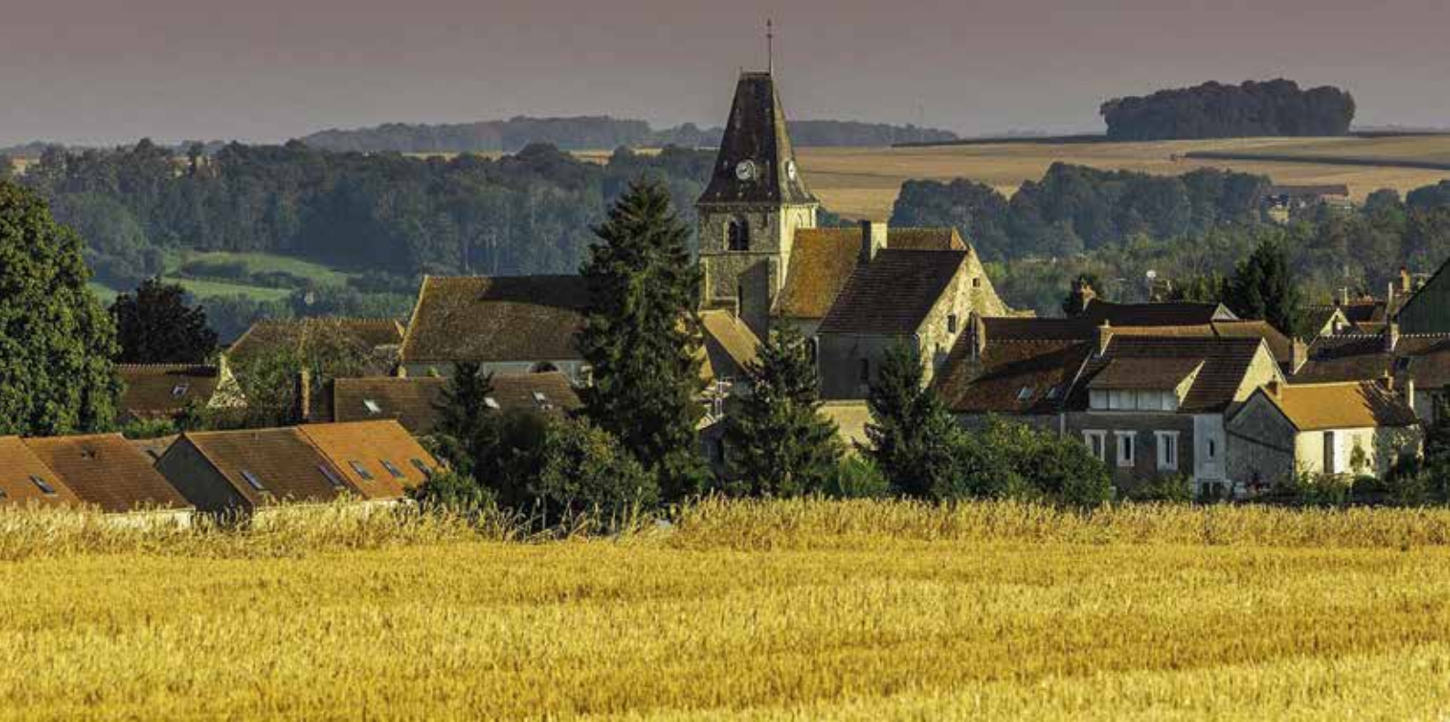
Le village d'Omerville