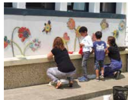
La Réserve naturelle nationale des coteaux de la Seine