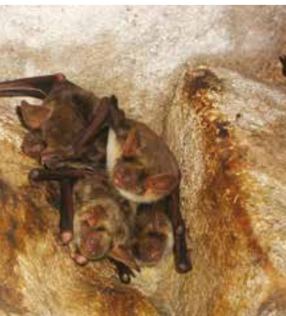
Colonie de Grands Murins

5% d'espaces naturels en Zones de Protection Forte (contre 2,4 % en 2024)