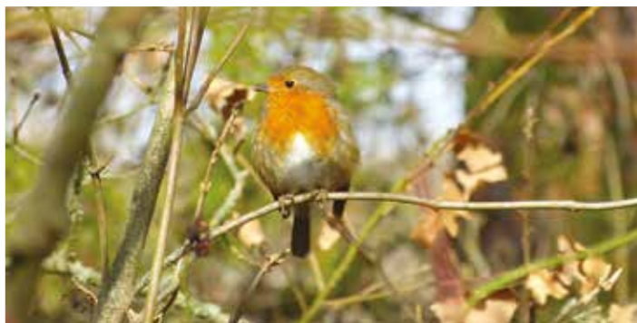
Sympetrum rouge sang Rouge gorge Lézard à deux raies Hélianthème blanchâtre Orchis militaire Astragale de Montpellier