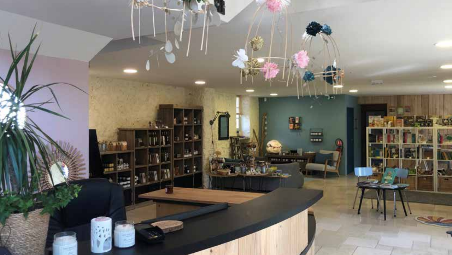
Accueil au musée du Vexin français : informations touristiques, boutique, expositions...