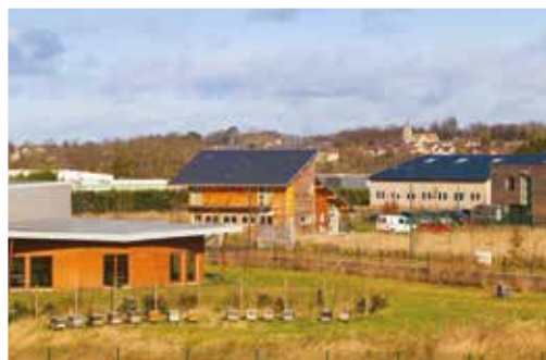
Parc d'activités économiques intercommunal à Ennery