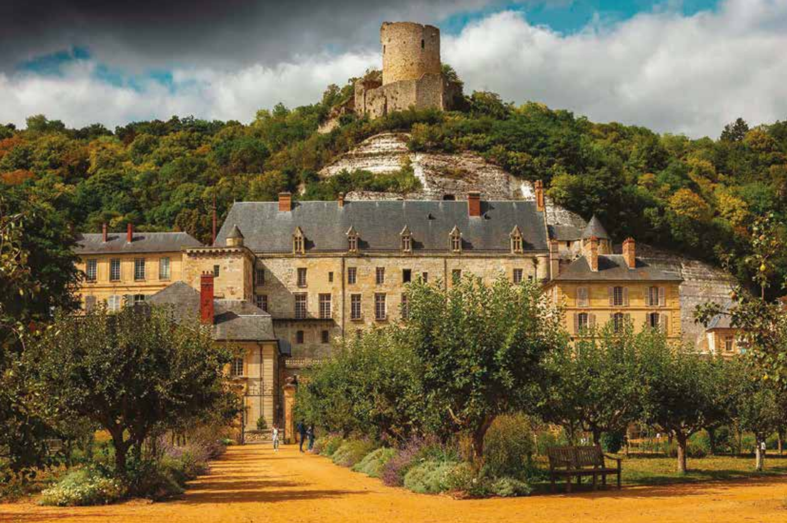
Château de la Roche-Guyon