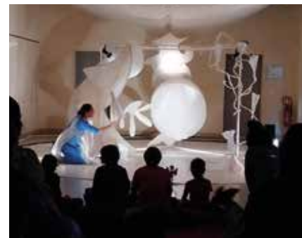
Événements culturels et spectacles