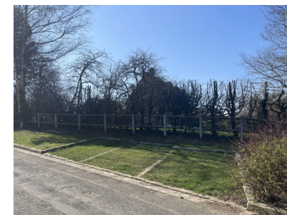
Emplacements en dalles alvéolées engazonnées (Maudétour-en-Vexin).