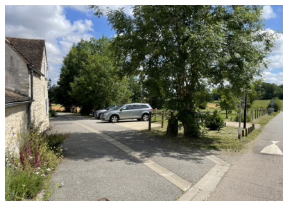
Une aire de quelques places de stationnement dédiée aux riverains et aux utilisateurs d'un parc (Hameau de la Chartre, Brueil-en-Vexin).

Les lieux de stationnement répondent à des besoins très divers : stationnement résidentiel, dépose minute (école, boulangerie,...), stationnement fréquent (mairie, médecin,...) stationnement occasionnel voire exceptionnel (manifestation annuelle...). Une analyse des pratiques au cas par cas, en intégrant également la place des vélos, doit aboutir à définir une offre de stationnement proportionnée sans la surestimer, ou la sous-estimer au risque de déplacement des pratiques.