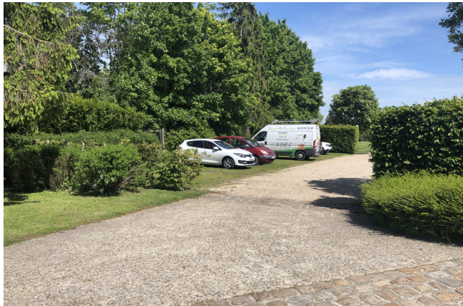
Une aire de stationnement intégrée dans son environnement (Maudétour-en-Vexin).