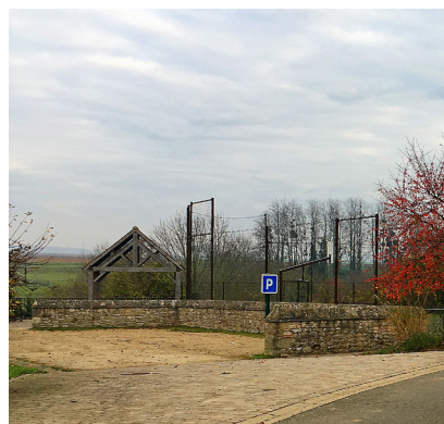
Un parking en simple stabilisé à la sortie de village aux abords du city stade (Moussy).