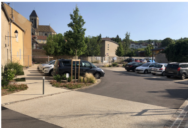
Un parking pour l'école et les commerces du centre (Vétheuil).

Parc naturel régional du Vexin français Maison du Parc - 95450 Théméricourt Tél. 01 34 48 66 10 - Fax : 01 34 48 66 11 Email : contact@pnr-vexin-francais.fr Site internet : www.pnr-vexin-francais.fr