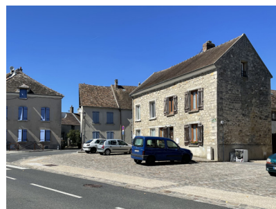
Aire de stationnement pavée en centre bourg (Cormeilles-en-Vexin).