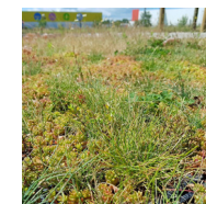
Dalles alvéolées plantées