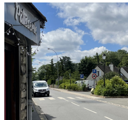
Une aire de stationnement à proximité des commerces (Seraincourt).