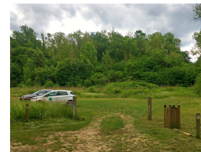
Parking en mélange terre-pierre (Genainville).