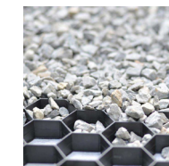
Stabilisateur de gravier