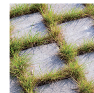
Pavés joints engazonnés