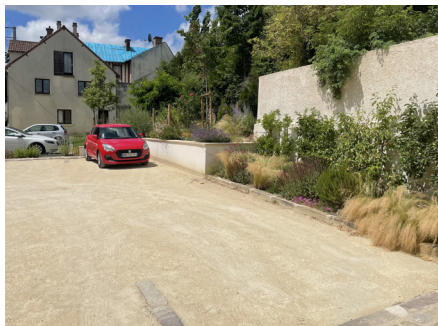
Un parking dédié aux riverains traité à la façon d'une placette de village (Evecquemont).