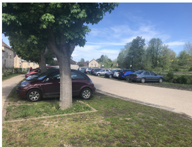
Stationnements perméables ombragés sous un alignement d'érables (Chaussy).