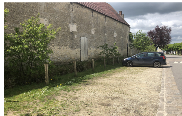
Noue plantée en fond de parking pour recueillir les eaux de ruissellement (Omerville).

Ils sont aussi utiles pour favoriser la biodiversité dans des lieux souvent stériles et les surfaces plantées permettent l'infiltration des eaux pluviales. Toutes les strates de végétation (arbres, haies taillées ou libres, noues plantées...) peuvent être envisagées.