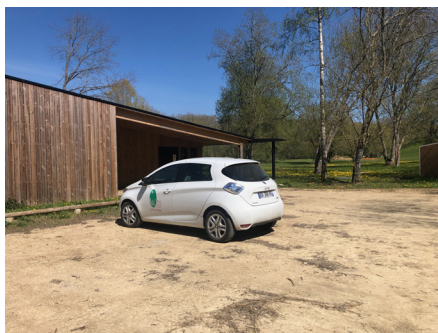
Aire de stationnement en stabilisé aux abords du site archéologique (Genainville).