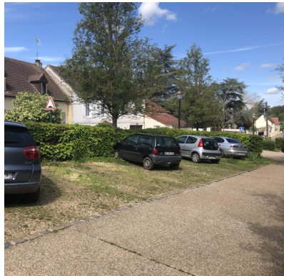
Une haie de charmille pour dissimuler le parking depuis la rue (Chaussy).