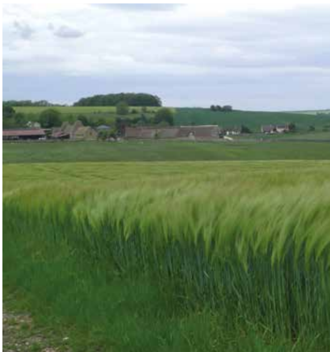
Vue sur la ferme de Buhy

Lors de votre balade, vous allez remarquer des haies au bord des champs. Elles servent à protéger du vent ou du froid pendant l'hiver et elles apportent de l'ombre et du frais l'été. Elles sont très utiles pour les animaux (escargots, oiseaux, insectes, petits mammifères). Dans ces haies, les animaux trouvent des abris et de la nourriture.