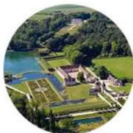
L'association La Source implantée dans le Domaine de Villarceaux en 2002