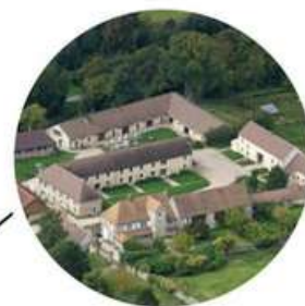
La Bergerie de Villarceaux lieu d'accueil de groupes ouvert depuis 2012