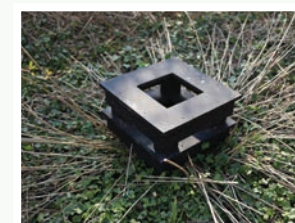
Cabinet de curiosités

Duo de danse et voix, au sein de l'installation "Le Jardin dans les Champs" réalisée avec les participants de Us.