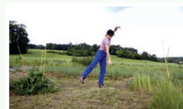
Duo des Herbes Folles

Duo de danse et voix, au sein de l'installation "Le Jardin dans les Champs" réalisée avec les participants de Us.