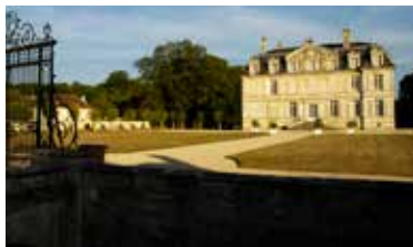
Château de Guiry-en-Vexin