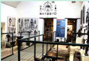
Musée de l'Outil