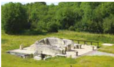
Site archéologique des Vaux-de-la-Celle