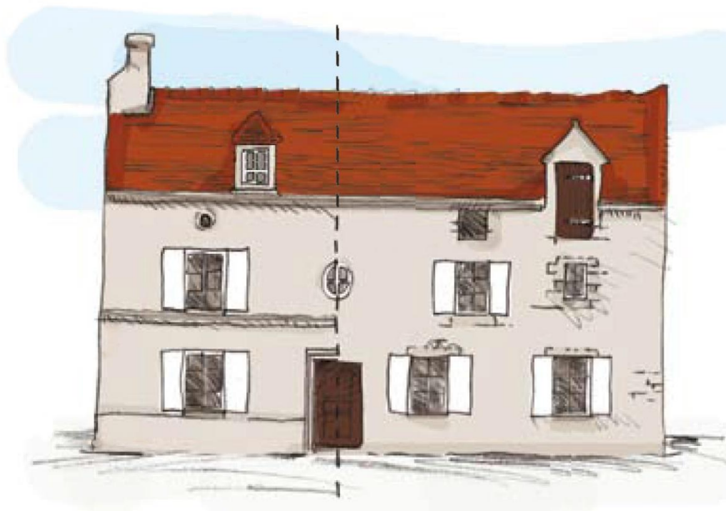
Maquette de la maison de notable